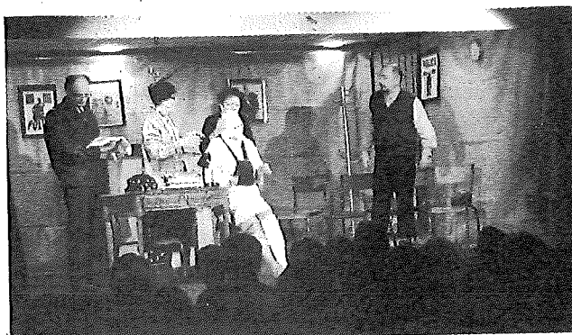
Des personnages extravagants pour le plaisir du public