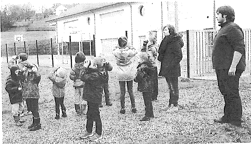
Phase pratique pour les enfants : l'observation des oiseaux avec les jumelles.

Ces animations répondent à trois objectifs : mobiliser un maximum de partici-